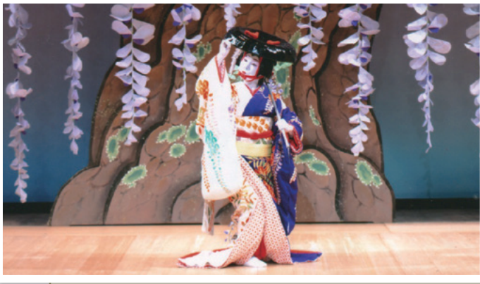
長唄「藤娘」平成24年2月、三条市立中央公民館大ホールにて