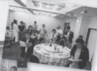
最後は皆さんで校歌の大合唱!!

で本当に楽しむことができました。 最後に女子高時代の校歌と現在の校歌を全員で歌い楽しいひと時を過ごすことができました。来年もまた参加してこの会を楽しみたいです。 参加したことのない方は本当に楽しい会なので来年、是非参加してください。よろしくお願ひします。