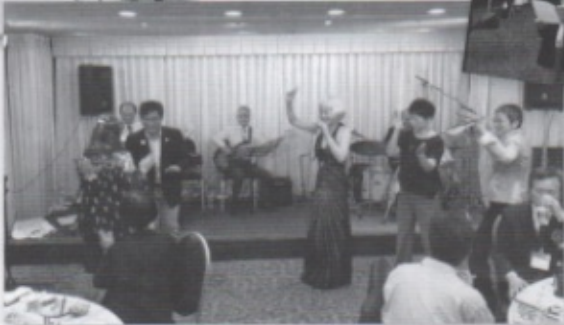
最高に盛り上がったアンバーの皆さんの熱いステージ!